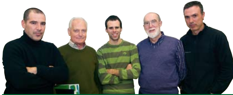
UDAL GOBERNU TALDEA